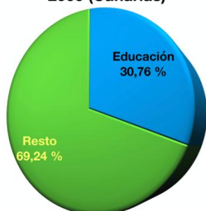
% Inversión en educación en el año 2000 (Canarias)